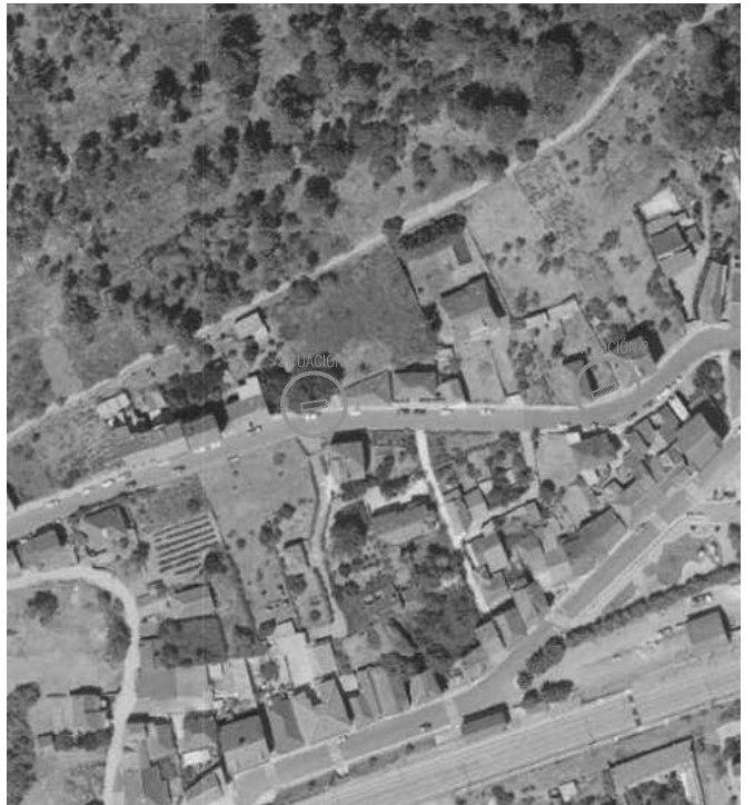
EMPLAZAMIENTO SOBRE SIGPAC, E 1/1.500