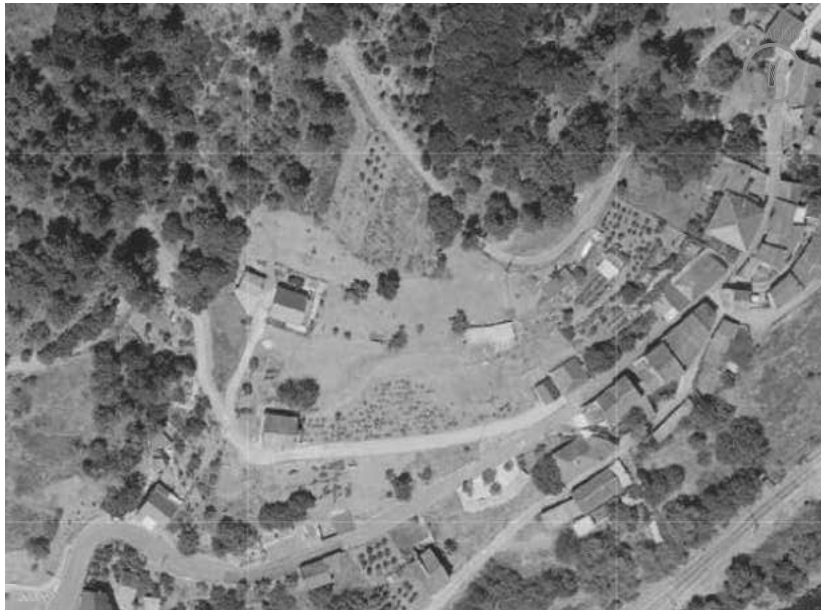
EMPLAZAMIENTO SOBRE SIGPAC, E 1/1.500