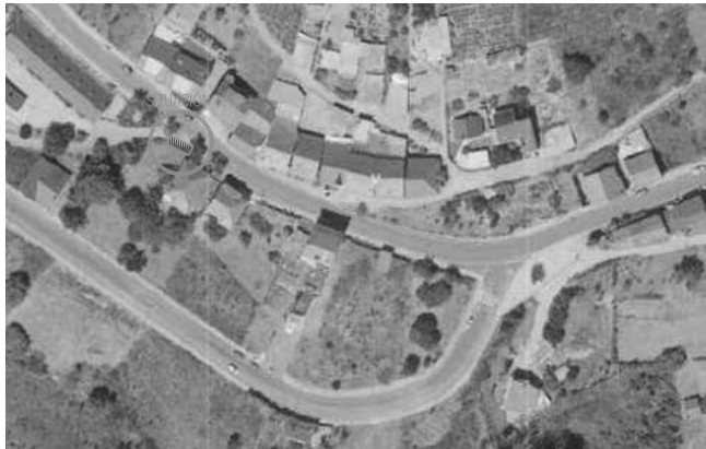
EMPLAZAMIENTO SOBRE SIGPAC, E 1/1.500